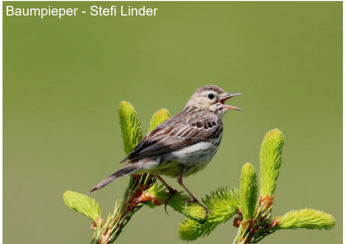
Baumpieper - Stefi Linder

Einst war er der häufigste Pieper der Schweiz, heute kommt er im Mittelland nicht mehr vor. In Mastrils aber kann sich diese Vogelart noch halten. Das typische Habitat dieses Vogels ist offenes Kulturland mit einzelnen Bäumen. Er kann nur in Wiesen seine Jungen aufziehen, die nicht vor dem 15. Juli gemäht werden. Besonders wichtig für diesen Pieper ist daher eine gut ausgebildete Krautschicht, da der Baumpieper sein Nest unter Grasbüscheln und krautigen Pflanzen anlegt.