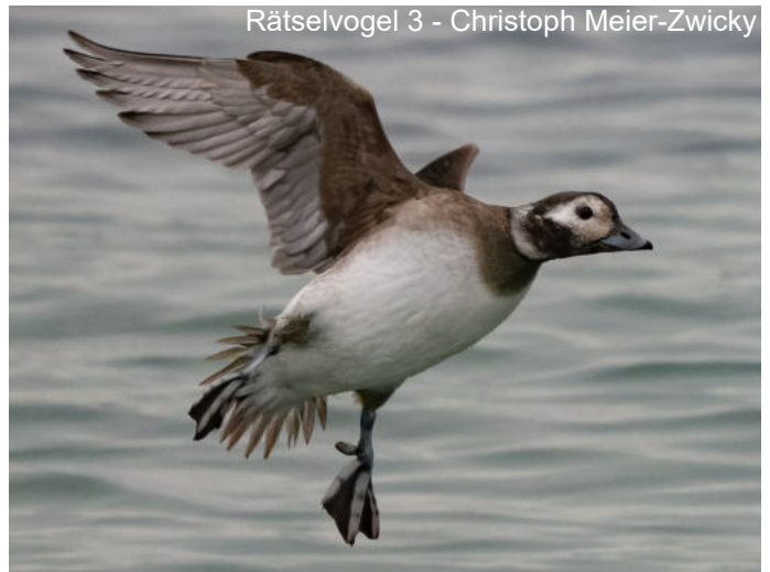
Rätselvogel 3 - Christoph Meier-Zwicky

Abendexkursion Witenen 24.06.2026 18:00 Uhr beim öffentlichen Parkplatz Saliel, Trimmis. Tour durch die Witenen. Die Witenen sind eine artenreiche Allmend am Übergang vom Wald zum Kulturland. Hier treffen die Arten des Offenlandes auf Vögel aus dem Wald. Die Strecke ist teilweise auf ungeteerten Wanderwegen und beinhaltet leichte Steigungen. Dauer 2-3h h. Falls der Anlass wegen des Wetters abgesagt werden muss, wird dies auf die Website aufgeschaltet.