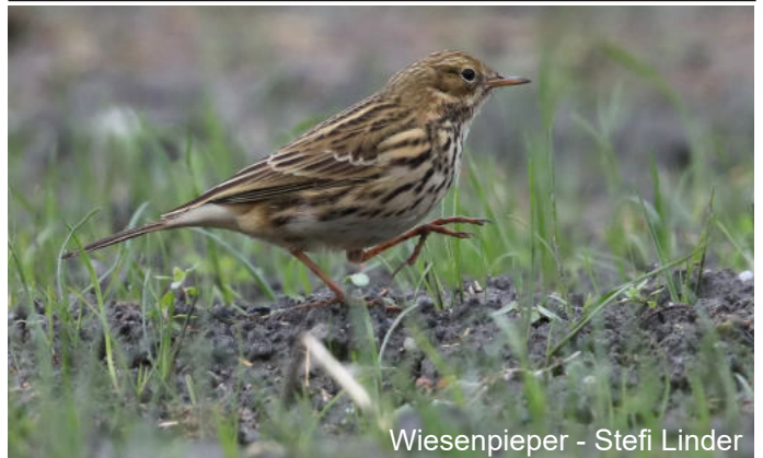
Wiesenpieper - Stefi Linder