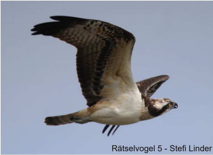
Rätselvogel 5 - Stefi Linder