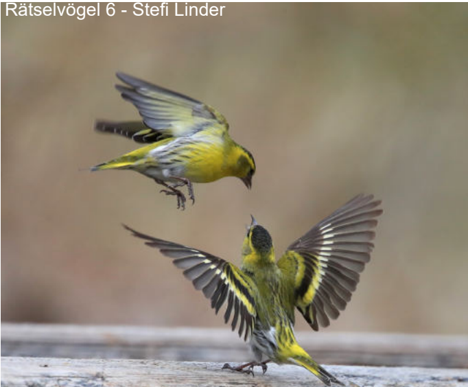
Rätselvögel 6 - Stefi Linder