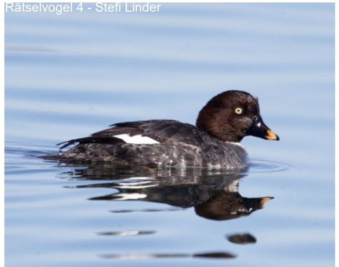
Rätselvogel 4 - Stefi Linder

Abendexkursion Biber 22.07.2026 18:00 Uhr beim öffentl. Parkplatz Gründeponie Untervaz. An diesem Abend beschäftigen wir uns mit dem Biber und seinen Spuren in der Landschaft. Mit sehr, sehr viel Glück, können wir auch einen Biber beobachten. Die Strecke ist eben aber teilweise ungeteert. Dauer ca. 2-3h. Falls der Anlass wegen des Wetters abgesagt werden muss, wird dies auf die Website aufgeschaltet.