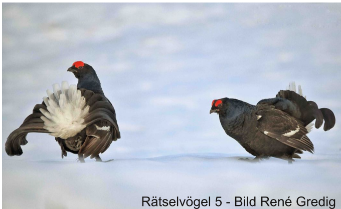
Rätselvögel 5

Bevor wir uns zu unserem zweiten Beobachtungsort, den Lagunen beim Rheindelta, aufmachten, sättigten wir uns mit bester Aussicht auf dem zugigen Damm mit unserem mitgebrachten Picknick und machten uns dann auf den Weg zu den Lagunen. Wie es bei uns üblich ist, kamen wir langsam vorwärts, überall gab es etwas zu schauen, zu beobachten und zu berichten. Die Lagunen tun dem Gemüt gut und überraschen auf Schritt und Tritt mit neuen Ausblicken und betörenden Lebewesen. Die Sonnenstrahlen zaubern einen schillernden Glanz aufs Wasser. Was sich da alles tummelt. Hunderte von Reiher-, Tafel-, Schnatter-, Kolben- und Stockenten und Blässhühnern finden Schutz in den Gewässern der Lagunen. Wir entdecken Moor-, Berg- und Schellenten und sogar zwei Nilgänse stöbern wir auf. Ein vorbeifliegender Purpurreiher und eine Rohrdommel bringen uns zum Staunen. Wieder einmal müssen wir uns richtig losreissen, damit die Pünktlichen nicht allzu lang warten müssen.