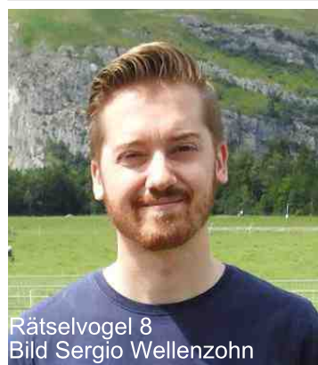
Rätselvögel 8