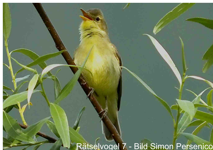
Rätselvögel 7 - Bild Simon Persenico