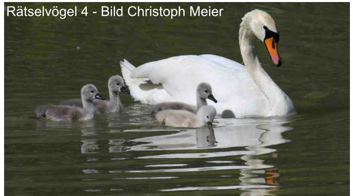
Rätselvogel 4

Unzählige Reiher- und Tafelenten dösten auf dem Wasser, aber bei den vielen Schwänen weiter entfernt handelte es sich ausschliesslich um Höckerschwäne. Auf relativ feuchtem Wiesenweg gelangten wir zum Hafen, wo sich zu unserer Freude Dutzende Brachvögel und Pfeifenten auf der gegenüberliegenden Wiese aufhielten.