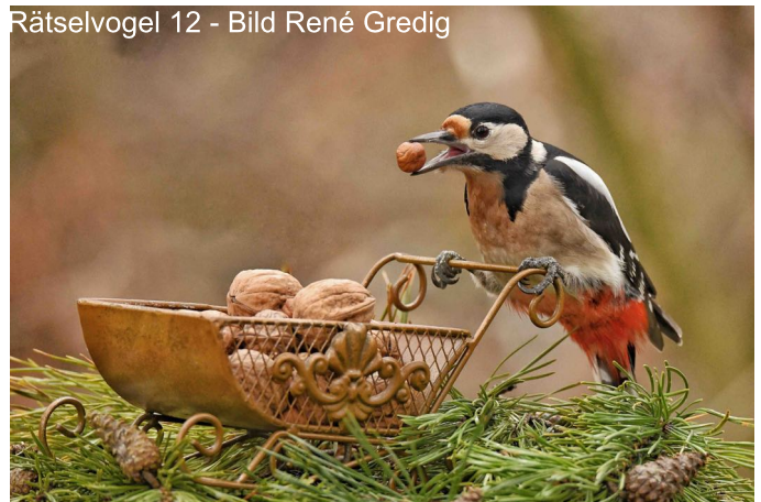
Rätselvogel 12