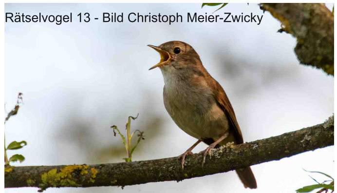
Rätselvogel 13