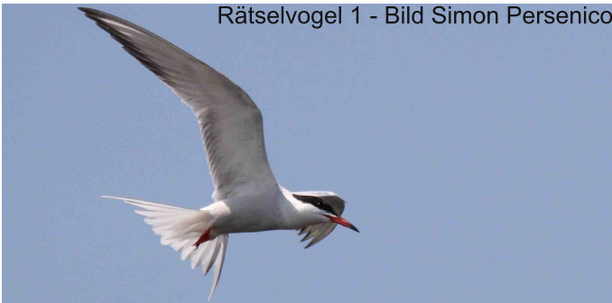
Rätselvogel 1

Der Einsatz wird maximal einen halben Tag dauern. Für Verpflegung ist gesorgt.