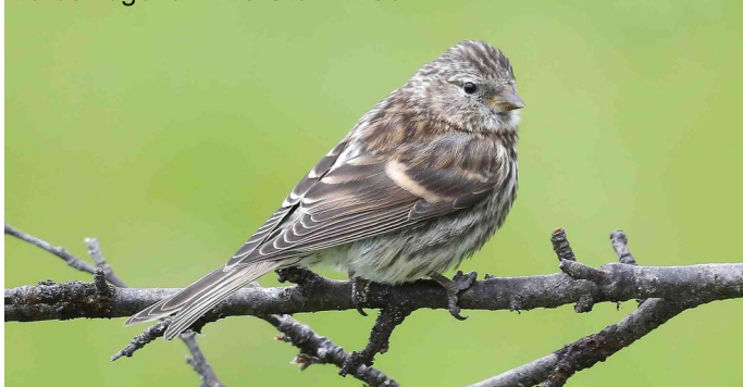
Rätselvögel 6