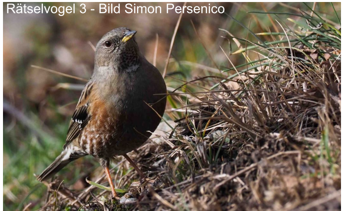
Rätselvogel 3