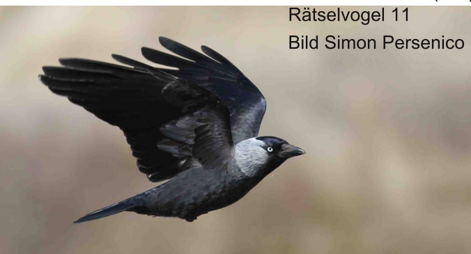
Rätselvogel 11

Im Jugendkleid trägt er eine zusätzliche Krallen am Flügel. Diese nutzt der Jungvogel, um im dichten Astgewirr umherzuklettern, bis er fliegen gelernt hat. Wobei auch die Altvögel nicht besonders flugtalentiert sind. Sein Verbreitungsgebiet ist das nördliche Südamerika, wo er in Gebüsch entlang von Gewässern lebt. Wenn man in der Natur auf diesen Vogel trifft, fällt auf, dass er sehr wenig Scheu gegenüber Menschen zeigt. Seine Lautäußerungen erinnern etwas an ein asthmatisches Husten und der Flug ist bedingt elegant. Die ganze Erscheinung des Hoatzins erinnert an die Urvögel wie Archäopteryx und lässt einem die Evolution der Vögel nachvollziehen. (SW)