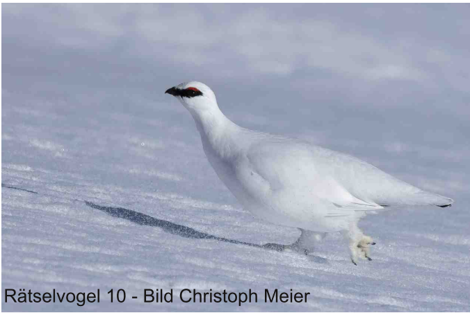
Rätselvogel 10