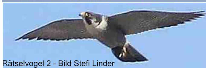
Rätselvogel 2