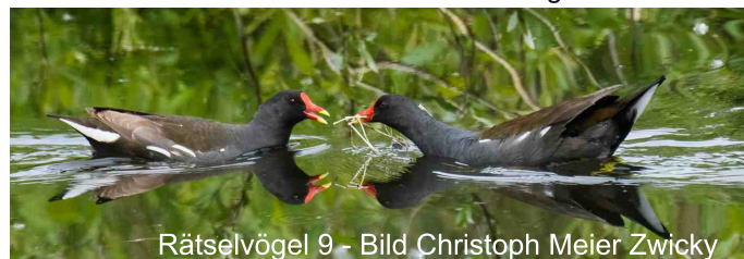
Rätselvögel 9