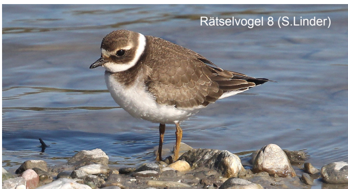
Rätselvogel 8