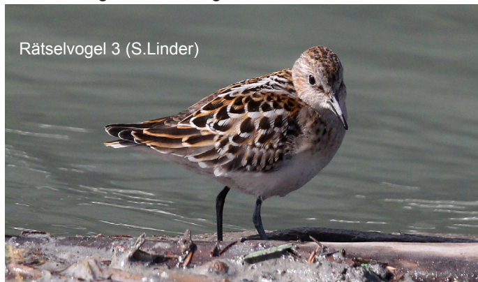
Rätselvogel 3 (S.Linder)

Paradieslilien sind nur einige davon. Fast könnte man vergessen, dass wir auf Vogelexkursion sind. Sobald das Wetter sich bessert und die Sonne sich zeigt, fliegen Hausrotschwänze, Berg- und Baumpieper, Bluthänflinge, Mauersegler, Heckenbraunellen und andere, 28 Arten an der Zahl, aus ihren Verstecken und erfreuen uns mit ihrem Gesang und die Jungen, deren es etliche hat, mit ih-