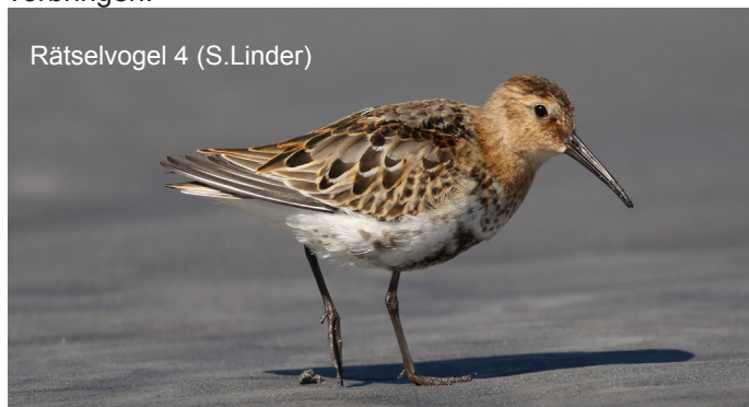
Rätselvogel 4 (S.Linder)

Von der Staumauer aus schauen wir einem Steinadler zu, der weit oben seine Kreise zieht und auch Felsenschwalben fliegen über uns. Erwähnenswert sind die fleischfressenden Fettkraut-Pflanzen, die an einer sehr nassen Felswand an der Südseite der Staumauer wachsen, sich kleine Insekten einverleiben und feine blaue Blüten hervorbringen.