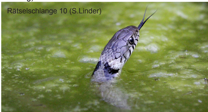
Rätselschlange 10 (S.Linder)

WICHTIG: wer eine Anfrage erhalten hat, soll bitte eine Rückmeldung an Luzi machen, ob er an dem betreffenden Tag mitmachen kann oder nicht (das erleichtert die Planung).