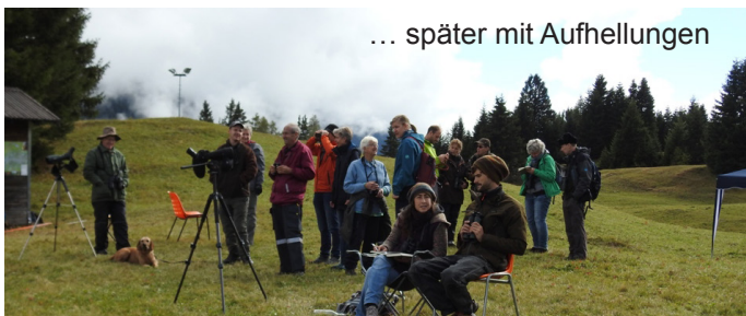
... später mit Aufhellungen

Einen extra Dank an Jolanda Ticar für die feine Gersensuppe, die angesichts der Witterung besonders willkommen war.