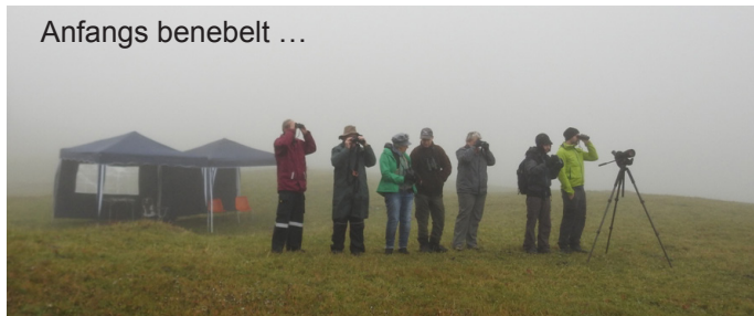
Anfangs benebelt ...

Auch in diesem Jahr war das Wetter mit langen Nebelphasen und eher spärlichen Aufhellungen nicht ideal. Trotzdem erlebten die total 20 Teilnehmenden bzw. Besucher ein paar schöne Beobachtungen: u.a. je ein Sperber und Steinadler, dazu ein Trupp von Gimpeln, die die sich den ganzen Tag in nächster Nähe aufhielten.