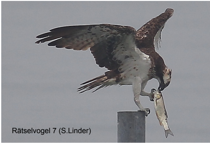
Rätselvogel 7 (S.Linder)