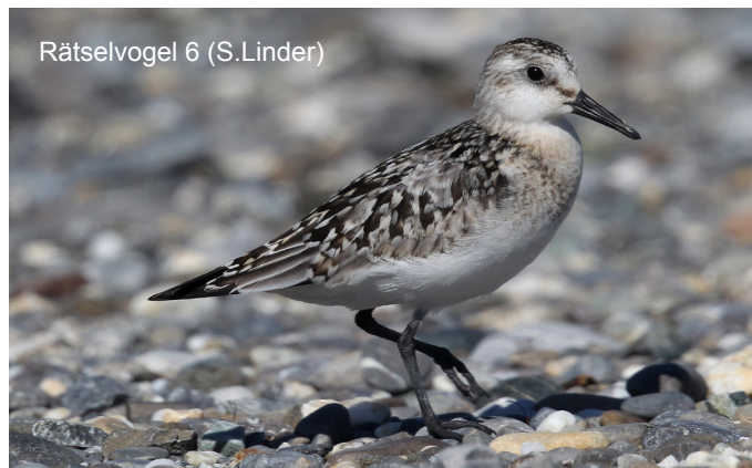
Rätselvogel 6 (S.Linder)

Die Auflistung lässt erkennen, dass der traditionelle Anlass einen erheblichen Aufwand mit sich bringt, der von den Beteiligten jedes Jahr wieder freiwillig bewältigt wird. Der Wettergott hat die vielen guten Taten leider nicht wirklich honoriert, aber das hat all denen, die mitgeholfen haben oder zu Besuch vorbeigekommen sind, die gute Laune nicht verderben können.