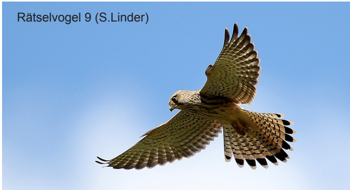
Rätselvogel 9 (S.Linder)