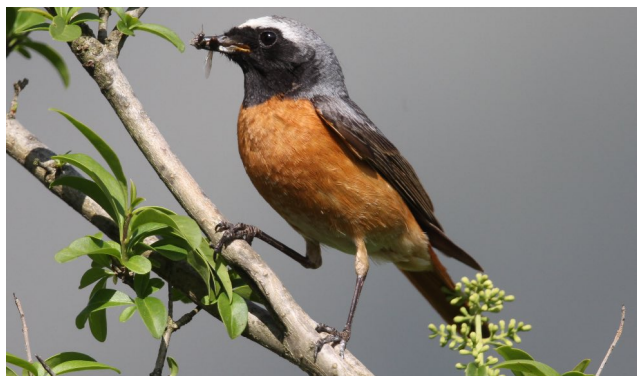
Gartenrotschwanz (Stefi Linder)