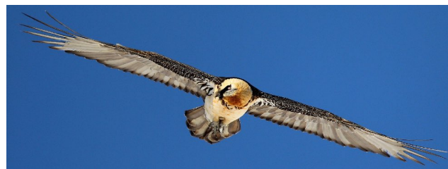
Bartgeier (Stefi Linder)

Den Höhepunkt des Tages erleben wir just im ersten Teil unserer Wanderung: Ein Bartgeier. Welche Überraschung. Wir begleiten ihn auf seinem Weg durchs Val Tuors mit unseren Feldstechern bis er unsern Blicken entschwindet. Eine Teilnehmerin nutzt diesen kurzen Augenblick sogar für ein Foto.